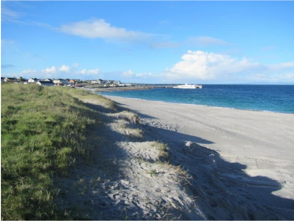
Dumhcha ísle muiríní atá i ngnáthóga na ndumhcha ar an Trá, a bhfuil féarach duimhche socra thart orthu ar thaobh na talún.