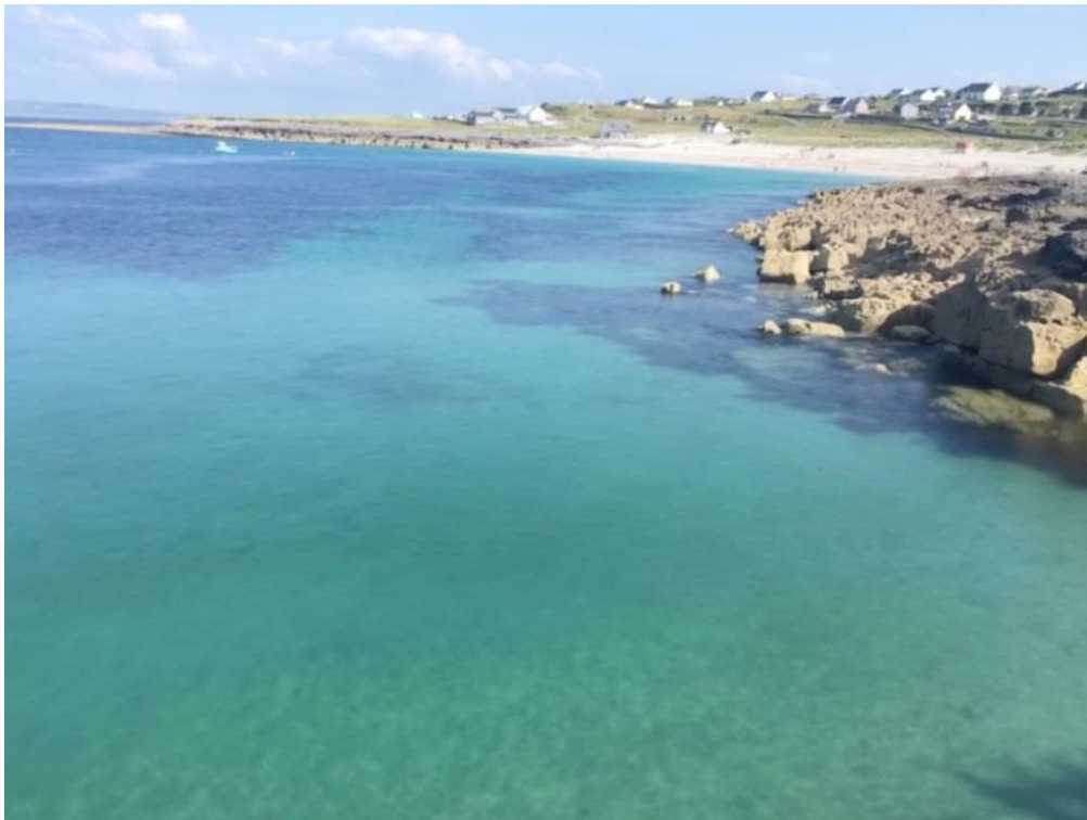
Gaineamh geal agus farraige ghlan ghorm na Trá, Inis Oírr.

Tá Inis Oírr ar an gceann is lú de na hOileáin Árann, agus tá sé suite thart ar 10km amach ó chósta Chontae an Chláir. Tá an Trá, príomhthrá álainn an oileáin, suite i dTuaisceart an oileáin agus tá gaineamh geal mín agus farraigí glana gorma ann. Is díol spéise suntasach é an t-oileán ar fad ó thaobh bithéagsúlachta, seandálaíochta agus cúrsaí cultúir.