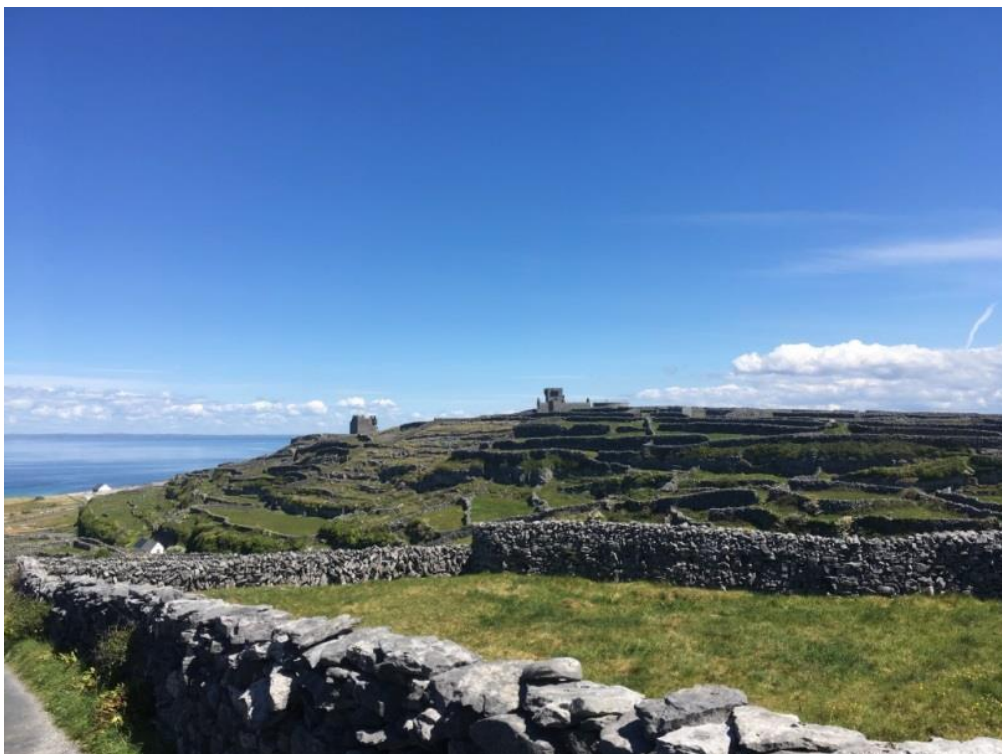
Caisleán Uí Bhriain agus Dún Formna leis an meascán de ghoirt mhúrtha atá saintréitheach don oileán mórthimpeall orthu atá le feiceáil ar a fud an oileáin.