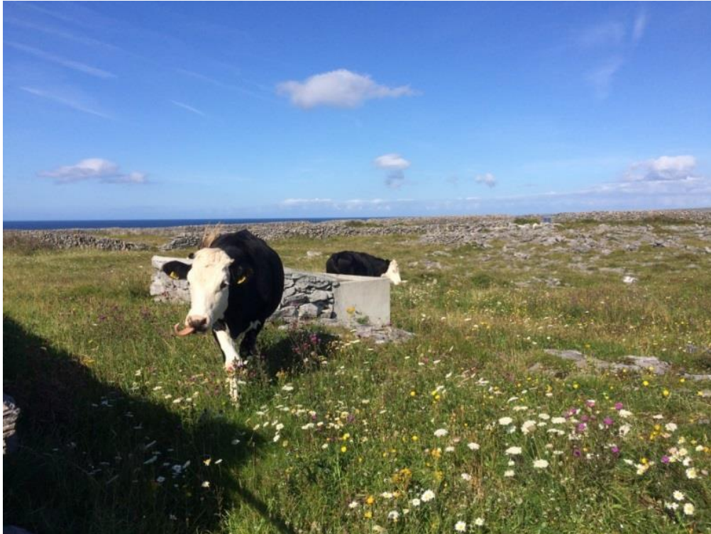
Is é tógáil eallaí ar dhéine íseal príomhfhiontraíocht an oileáin agus tá sé riachtanach chun bithéagsúlacht fhéaraigh an oileáin, atá saibhir ó thaobh speicis, a choinneáil.