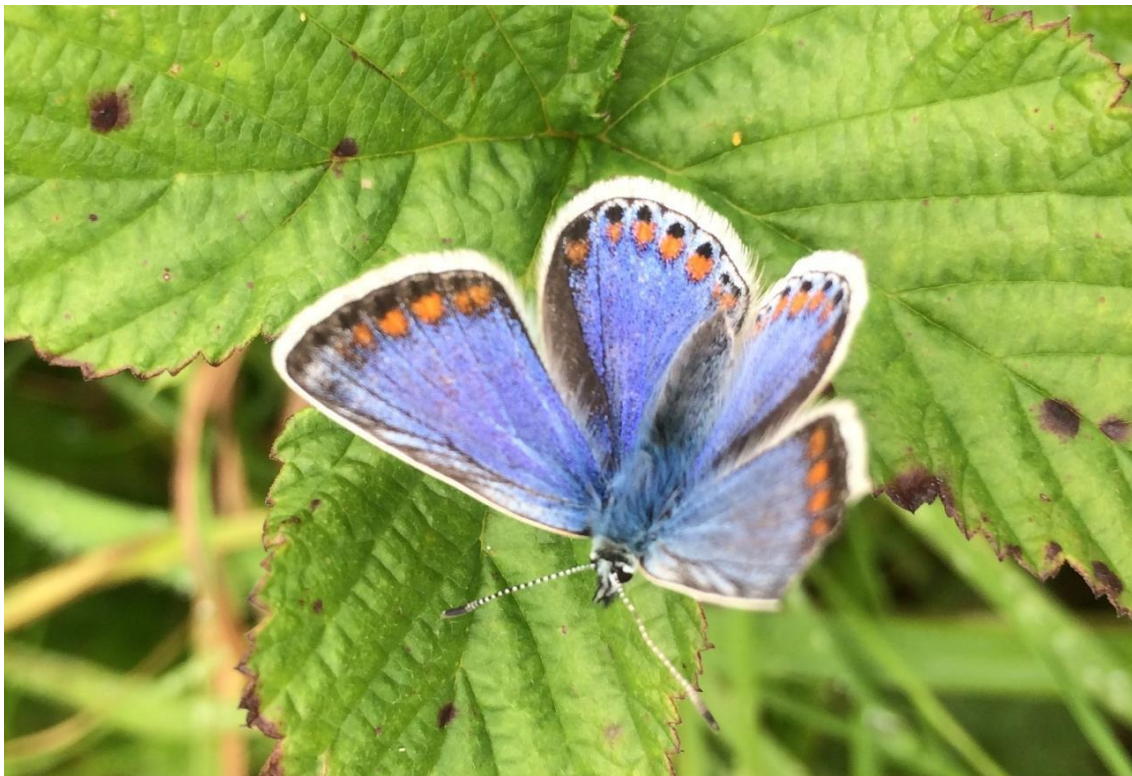
An gormán coiteann a mbeathaíonn a bholb ar chrohb éin

Mar aon le flóra iléagasúil sin na n-oileán, tá féileacáin agus leamhain a bhíonn ag eitilt sa lá fairsing chomh maith. Is féidir féileacáin amhail an gormán beag, a bheathaíonn é féin ar mhéara Muire, agus an gormán coiteann a chothaíonn é féin ar chrohb éin, a fheiceáil sna féarthailte cois cósta ag tús an tsamhraidh agus ag deireadh an tsamhraidh.