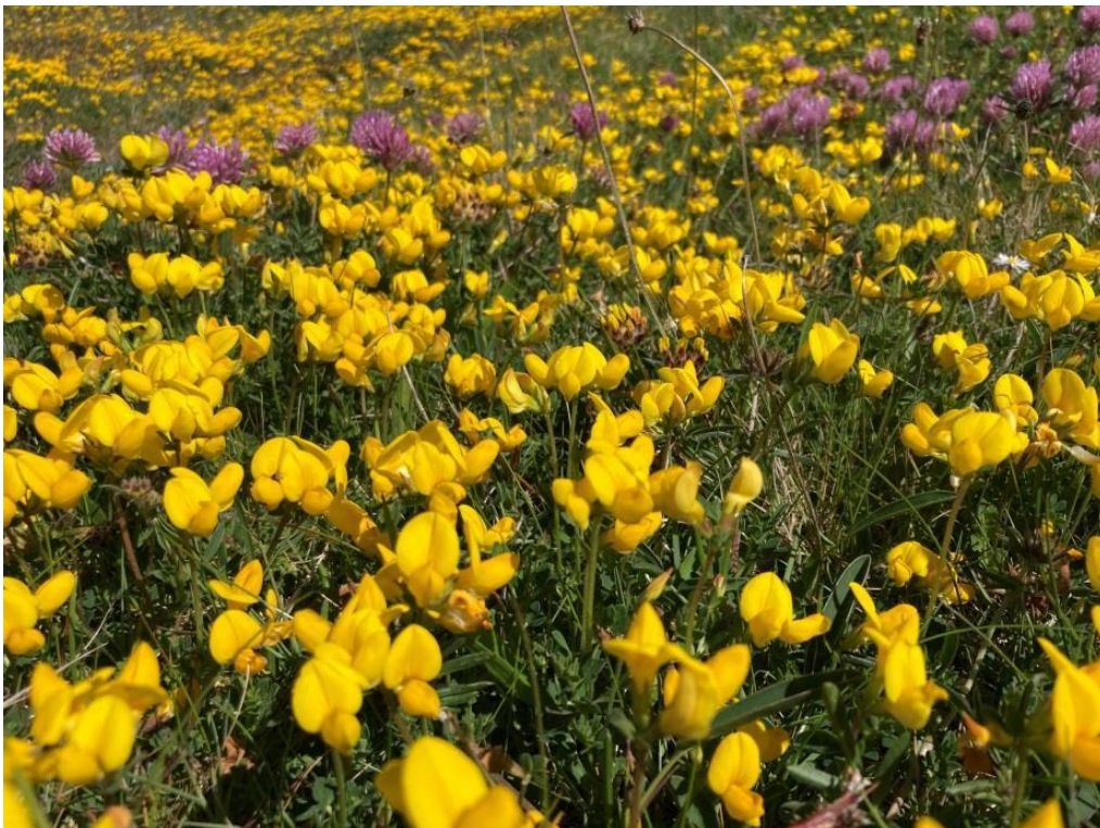
Bíonn dath buí ar na dumhcha socra le linn an tsamhraidh, tráth a mbíonn crobh éin agus méara Muire faoi bhláth.