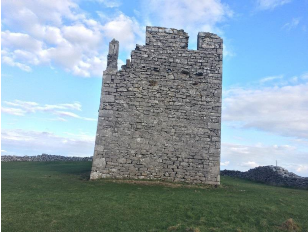
Caisleán Uí Bhriain a tógadh laistigh de Dhún Formna ar an gcuid is airde den oileán