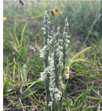
Is féidir magairlín na mbeach a fheiceáil i mí Meithimh, magairlín na stuaice i mí Iúil agus cúilín Muire an tsamhraidh i mí Lúnasa

Mar aon le flóra iléagasúil sin na n-oileán, tá féileacáin agus leamhain a bhíonn ag eitilt sa lá fairsing chomh maith. Is féidir féileacáin amhail an gormán beag, a bheathaíonn é féin ar mhéara Muire, agus an gormán coiteann a chothaíonn é féin ar chrohb éin, a fheiceáil sna féarthailte cois cósta ag tús an tsamhraidh agus ag deireadh an tsamhraidh.