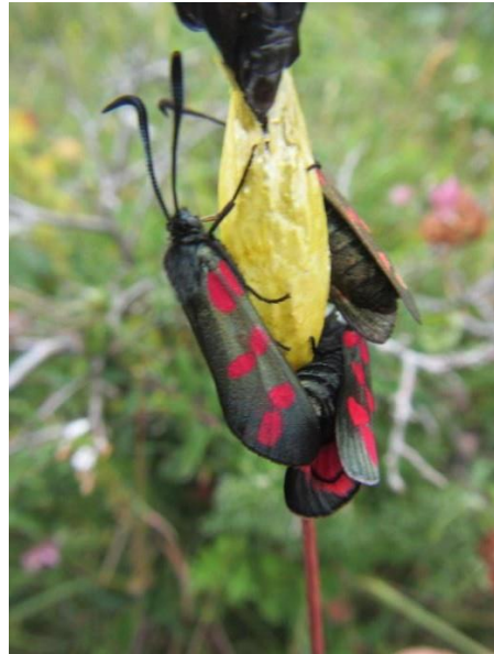
An buirnéad sébhallach

Is baile é na gnáthóga cósta ar fud an oileáin do roinnt speiceas tábhachtach éin amhail an cág cosdearg, ar éan d'fhine an phréacháin é a dhéanann nead ar aillte cósta. Neadaíonn speicis de gheabhróga anseo freisin ó am go chéile, amhail an gheabhróg Artach, an gheabhróg bheag agus an gheabhróg scothdhubh. Caitheann an gheabhróg Artach an geimhreadh san Afraic Theas agus chomh fada ó dheas le hAntartaice agus is cuairteoir anseo é le linn an tsamhraidh ó Márta go Meán Fómhair. Tagann geabhróga beaga anseo ó am go ham, idir mí Aibreáin agus deireadh mhí Lúnasa agus déanann lear mór acu nead ar an talamh le chéile ar thránna scaineagáin, rud a fhágann go mbíonn siad leochaileach go leor do dhrochaimsir agus do shuaitheadh ar bith. Tagann geabhróga scothdhubha ar cuairt ó mhí Márta go mí Mheán Fómhair agus caitheann siad an geimhreadh i ndeisceart na hEorpa agus san Afraic. Feictear speicis éanlaithe talaimh feirme, amhail an fhuiseog, an clochrán agus an caislín cloch go rialta sna goirt chósta agus ar fud an oileáin.